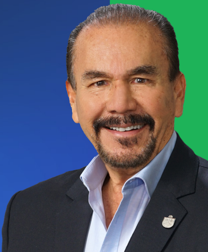
El Presidente Municipal Pedro Rodríguez Villegas