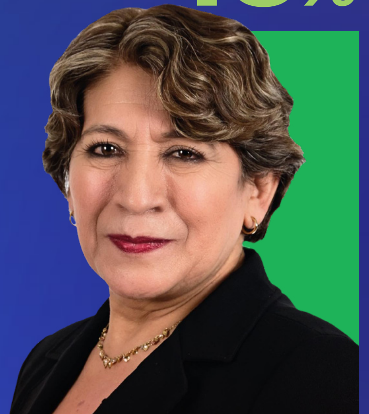
La Gobernadora Delfina Gómez