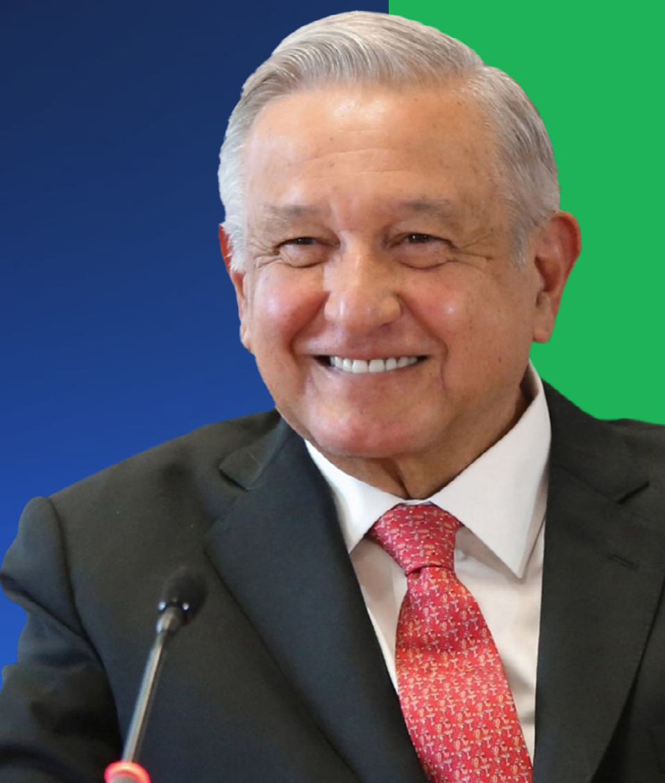
El Presidente Andrés Manuel López Obrador