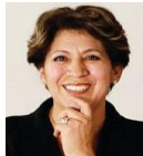
20. MORENA Delfina Gómez Álvarez