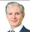
11. PRI Alfredo del Mazo