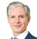
21. ENCUENTRO SOCIAL Alfredo del Mazo