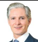
17. PANAL Alfredo del Mazo